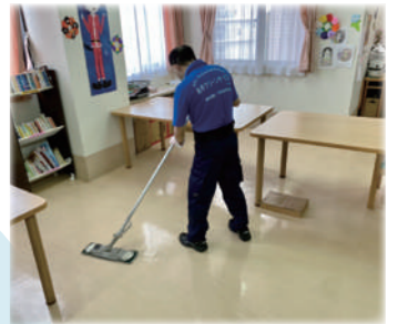
あゆクリーンサービスの作業風景▶