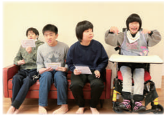
▲卒業と進級お祝いをしました♪

ドリームで、卒業・進級のお祝いをしました。あつという間の一年間でしたが、子どもたちの成長を感じています。引き続き、今年度の支援にしっかり繋いでいきます。