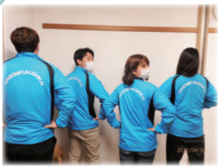
▲せせらぎブルーの新ユニフォーム♪

せせらぎ事業部で、ユニフォームを新調しました。ユニフォームのカラーは、青空のようなせせらぎブルー♪ 職員一同、気持ちを新たに仕事に励みたいと思います。