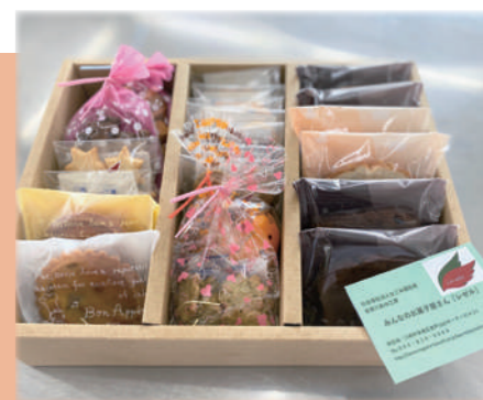
▲レゼルのこだわり焼き菓子詰め合わせ♪

レゼルでは、毎日利用者の方々が心を込めて一生懸命美味しい焼き菓子を作っています。主にパウンドケーキ、タルト、クッキー、マドレーヌなど、約30種類の商品があります。保存料や添加物は極力使用せず、よつ葉バターやスーパーバイオレット（小麦粉）など材料にはこだわっています。また、近隣の梨園や農家の方々に協力していただき、梨やはちみつ、のらぼう菜は多摩区内で収穫されたものを使用しています。特にフロランタンやガレットブルトヌ、梨のタルトなどは人気があり、リピーターの方もたくさんいます！クリスマスやバレンタインなどのイベント時にはギフトセットを作ったり、お中元やお歳暮などギフトも毎年多数ご注文いただいています。大人気のレゼルの焼き菓子、是非一度ご賞味ください！ 大屋