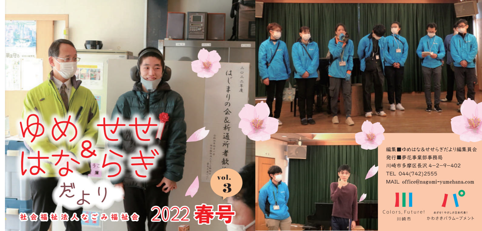
上画像 左：夢花で新しい仲間を迎える「はじまりの会」 右：せせらぎ「はじまりの会」で挨拶をする新職員と新しい仲間

※社会情勢により延期・中止等の可能性があります、それぞれの予定は念のため事前に確認下さい。 ※ 公園販売 毎月第3水曜開催、詳細はWEBでご確認下さい。