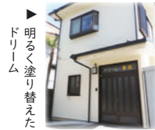
▶ 明るく塗り替えたドリーム

また、昨年度建物の外壁のリフォームを行っています。内装はそのままですが、気持ちもあらたに活動して行きたいと思ひます。 釜山