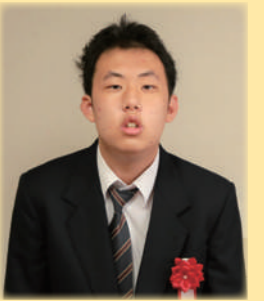
▲夢花工房の新メンバー♪

加と、支援者の不足が理由で閉鎖をされる事態となり、通所ができなくなった利用者や、陽性が確認された利用者の支援をグループホームで24時間の支援体制を組んで担う事になりました。川崎市から感染予防用の防護服等の提供を受け、保健所の指導に従い、予防対策を徹底しても支援者が感染する可能性は消えません。次は誰が陽性になるかとハラハラするような状況で、夢花、せせらぎともに、何人もの職員が身体を張って支援をしてくれた事で、3月中旬までの大変な時期を乗り越える事が出来ました。