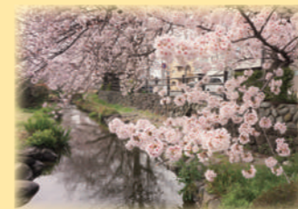
▲きれいに咲いた今年の二ヶ領用水の桜

コロナ感染は陽性になった人だけでなく、濃厚接触者に指定された人も一定期間、出勤停止となります。地域の日中施設の数か所が感染者の増