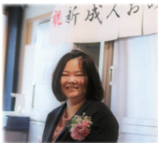
▲新成人を祝う会のスナップ

春の日差しが心地よい時期となり、爽やかな陽気に包まれながら、こうしてまた新年度を迎えられた事を大変喜ばしく思ひます。さて、夢花工房では昨年度1月に新成人を祝う会を行いました。同じ夢花工房の先輩方や職員に見守られながら、凛々しくそして穏やかな表情を浮かべる姿は感慨深いものがありました。これからも豊かで楽しい生活を送れるよう、夢花事業部一同で応援して参ります。 小幡