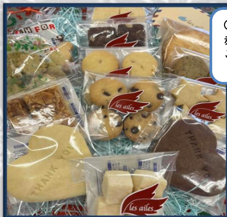
③クッキー1,500円セット

クッキー 13種 【サンクス・フロランタン・のらぼう・ はちみつ・チョコチップ・紅茶・ アマンド・アマンドショコラ・ サイコロ・塩・オレンジピール・ ココア・ガレットブルトンヌ】