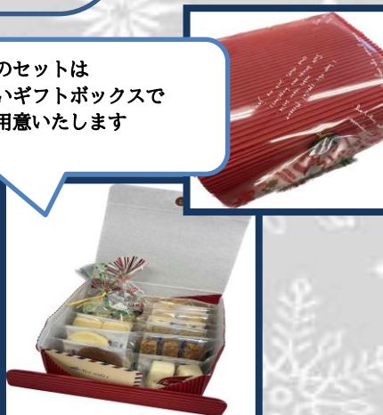
④チョコ多めの1,500円セッ

クッキー 13種 【サンクス・フロランタン・のらぼう・ はちみつ・チョコチップ・紅茶・ アマンド・アマンドショコラ・ サイコロ・塩・オレンジピール・ ココア・ガレットブルトンヌ】