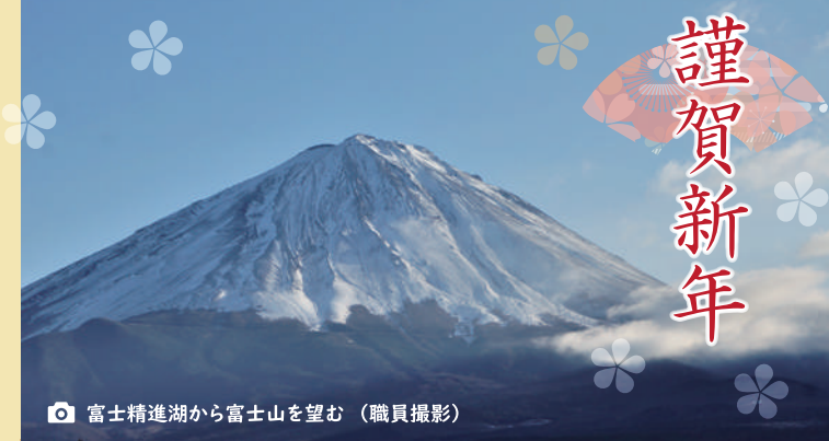
富士精進湖から富士山を望む

旧年中は大変お世話になりました。昨年10月よりサービス提供責任者をさせて頂くことになりました。まだまだ不慣れで皆様に助けて頂きながらではございますが、ヘルパーステーション夢花として、担当職員と力を合わせてサービスの提供に努めてまいりますので、どうぞよろしく願い致します。