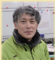
副事業部長 管理者 釜山

昨年はウクライナの戦争やコロナと目まぐるしい1年でした。そのため、今年はより一層、障害者福祉の先行きを見越し、サービスのあり方を考え、提供していくことが求められます。そのうえで利用者様がより充実した活動を送れる1年になるよう取り組んでまいります。