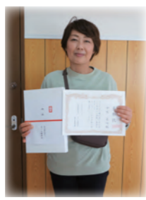
夢花の永年表彰のスナップ ▶

●永年勤続表彰 なごみ福祉会での勤務が5年を経過した方に記念品と賞状をお渡ししました。該当者はホームの常勤2名、非常勤4名、ドリームの非常勤1名です。これからも健康に気を付けて頑張ってください。