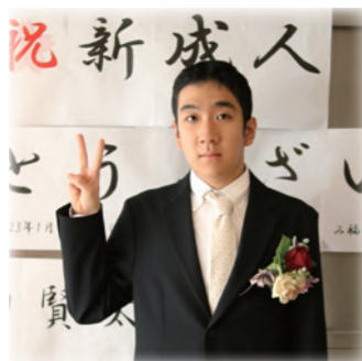
成人のお祝いをして記念撮影▶