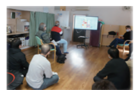
▲地震対策ビデオで研修中

防災委員会 3.11の東日本大震災から12年が経過し、身近などろでの地震等の災害への備えは欠かせない状況です。地震対策ビデオ「我が家の防災対策」で職員研修を行い、事前の準備と発生後の対応について改めて学びました。グループホームに備蓄品倉庫を新たに設置しコロナ禍の中でも密を避けて、職員だけの避難訓練を実施するなど、安全安心の為の取組を継続しています。