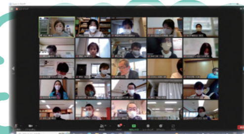
▲リモート報告会のスクリーンショットより