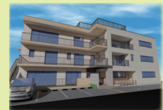
▲中野島新施設外観イメージ

法人での取り組み 中野島市営住宅内の市有地に、なごみ福祉会が新しい施設を設置運営する事が、昨年度、川崎市の選定を受けて決定しました。利用者の方にとって使いやすく、地域の方との交流と災害時にも役立つ事を前提に、職員のアイデアを盛り込んだ設計図が3月末に完成。新施設は生活介護と就労継続B型事業所として、来年4月1日に開所します。地域の方と特別支援学校の卒業生の利用を想定していますので、施設の建設と同時に、多摩川あゆ工房を中心として事業所で提供する支援内容の検討と実習等の受け入れ準備を、通常の業務に引き合いながら、取り組む必要があります。 今回の新施設の受託に関しては、法人内の協議において、その責任を果たすことの困難さを想像し、心配の声も多かったです。最終的に、社会福祉法人として地域福祉に果たすべき役割を優先する事になりました。法人全体の総力を挙げての取組となります。