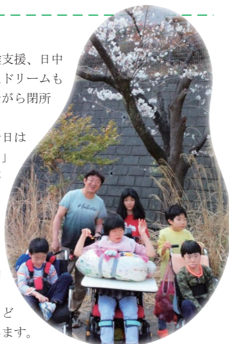
▲桜の下でドリームの子どもたち♪