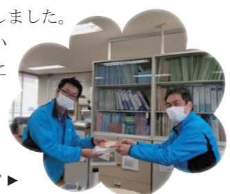
せせらぎの永年表彰のスナップ ▶

●永年勤続表彰 勤続5年の永年表彰は、常勤職員2名と非常勤職員4名の計6名の方に賞状と記念品をお渡ししました。今後のますますの活躍を期待しています。令和6年4月の新施設開所に向けて準備が進む中、並行して職員採用も進め、安定的に開所できるように準備をしていきます。