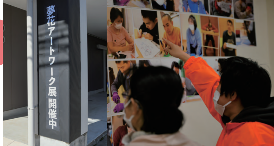
▲2月に開催した「夢花アートワーク展2023」せせらぎ作品も共同展示しました!