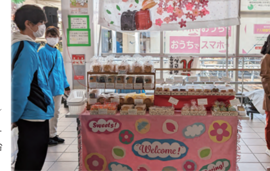
▲「みんなのお菓子屋さんレゼル」春の出店風景♪