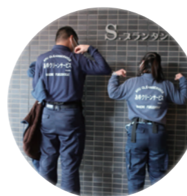
▲あゆクリーンサービスのユニフォーム