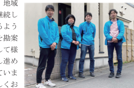
▲なごみグループホームの職員

●なごみグループホーム(GH) *HSはヘルパーステーション GH31名、HS10名のスタッフに加え、夢花事業部、あゆ工房支援者にも協力をもらいスタートしました。GHではコロナの影響で自粛していた泊旅行の再開を検討しています。また12月を目指して、登戸に新ホームの開設も予定しています。HSは、地域のニーズに応え、継続して支援を提供できるように支援者不足の実情を勘案しながら事業体として様々な可能性を検討し進めていきたいと考えています。今年度もよろしくお願ひいたします。